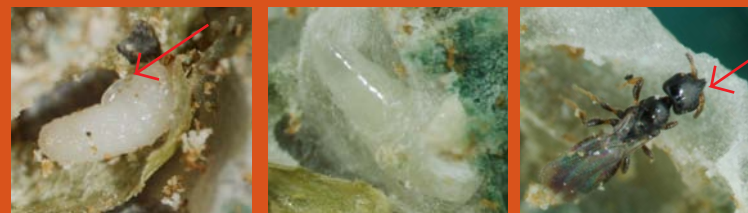
Figura 1. Avispa de Uganda. a). Huevo de la Avispa sobre una prepupa de broca; b). Larva contruyendo un capullo; c). Adulto dentro de un fruto brocado, la flecha indica el pico en la cabeza.

D espués de la llegada de la broca del café a Colombia, se introdujeron varias avispidas de origen africano: La avispa de Uganda, Prorops nasuta , en el año 1989-1990 y 1996 (Figura 1 a, b y c), la avispa de Costa de Marfil, Cephalonomia stephanoderis , en 1989-90 (Figura 2) y la avispa de Togo, Phymastichus coffea , en 1995 (Figura 3a, b, c y d). Estas avispidas se liberaron con el objetivo de establecerlas en los cafetales para regular las poblaciones de la broca.